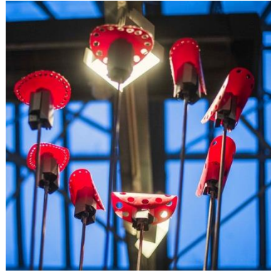
Christof Schläger und die Klangmaschine Brauser

SOUNDSEEING lädt noch bis Ende September Klangbegeisterte zu vielen spannenden Konzerten, Workshops und Ausstellungen ein.